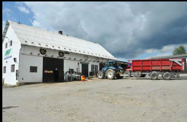
VOD Jetřichovec – nádvoří, dílny