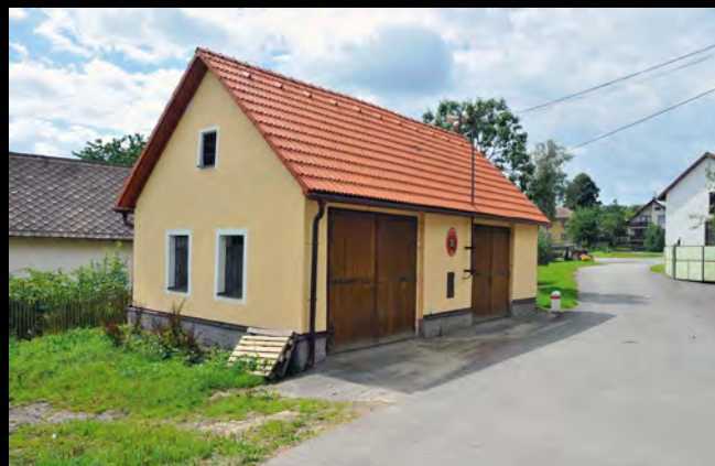
Původní hasičská zbrojnice