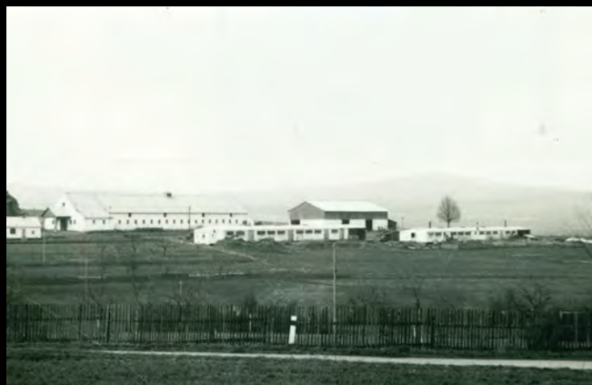
JZD Jetřichovec – celkový pohled, 60. léta