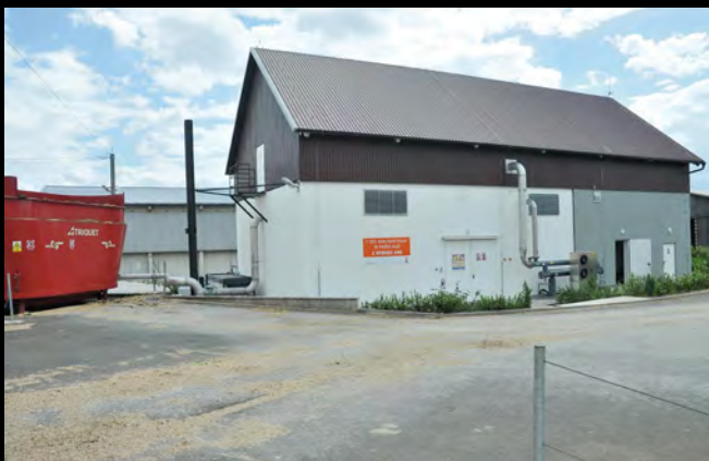
VOD Jetřichovec – bioplynová stanice