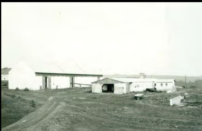
JZD Jetřichovec – odchovna vepřů a kolna, 1962–1963