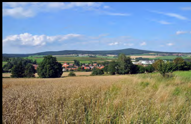
Pohled na Jetřichovec, v pozadí vrch Stražiště (744 m n./m.)