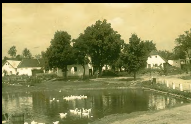
Historická fotografie z roku 1930