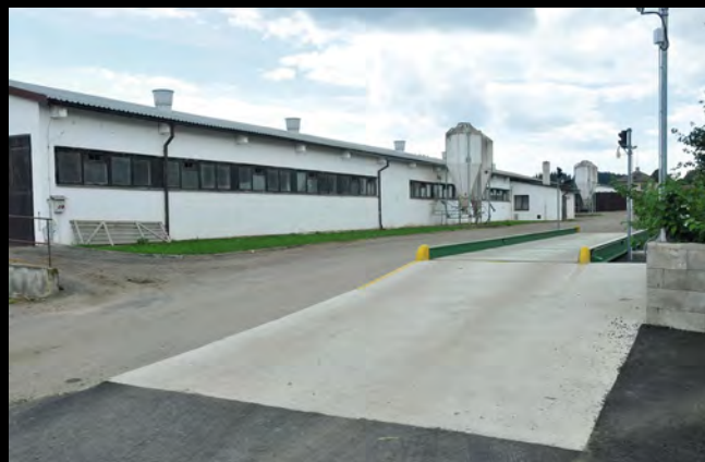
VOD Jetřichovec – odchovna prasnic a mostní váha