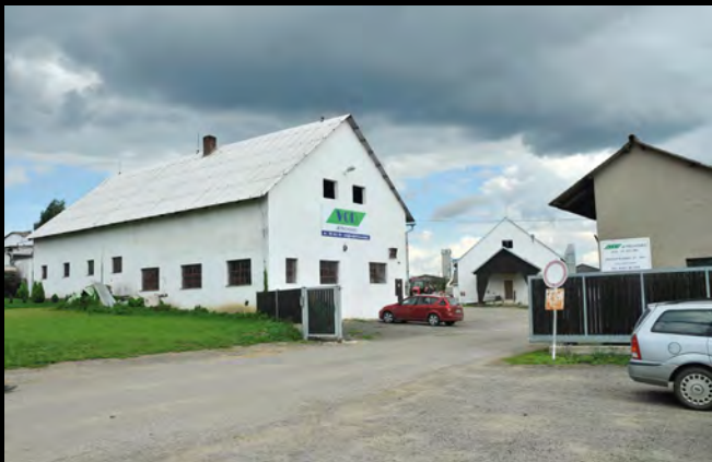
VOD Jetřichovec – vstup do areálu