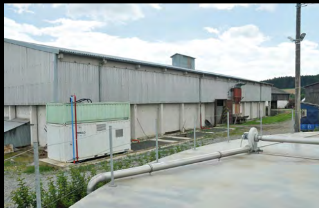
VOD Jetřichovec – sklad obilí