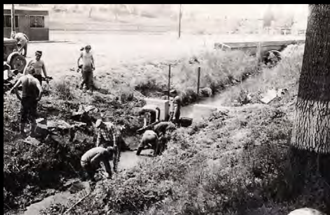
Zatrubnění návsi, 70. léta