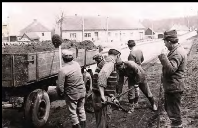
Terénní úpravy, 70. léta