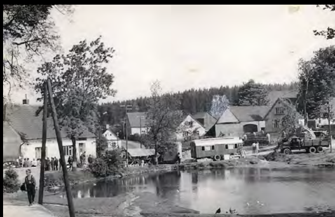
Začátek úprav návsi, 70. léta