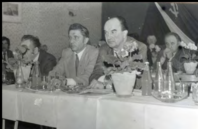
Výroční schůze JZD Jetřichovec, 70. léta