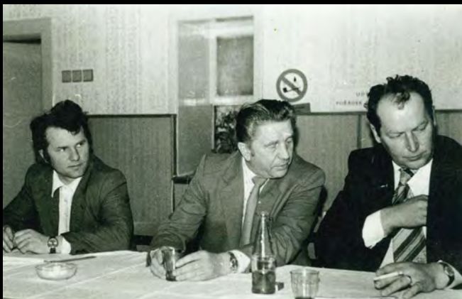
Výroční schůze JZD Jetřichovec, 80. léta