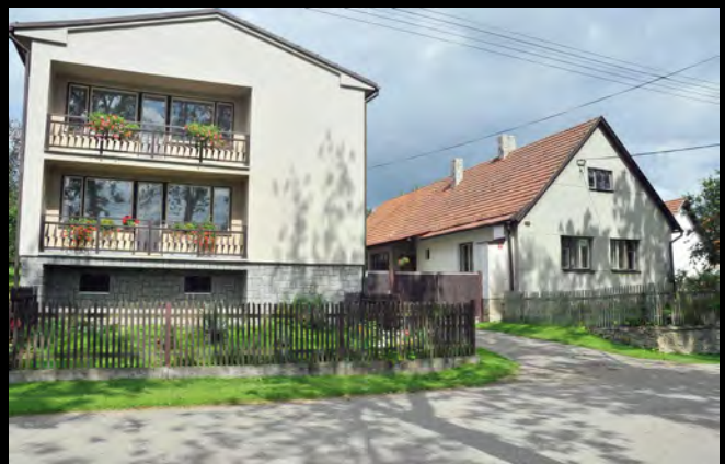
Čp. 57 – vlevo