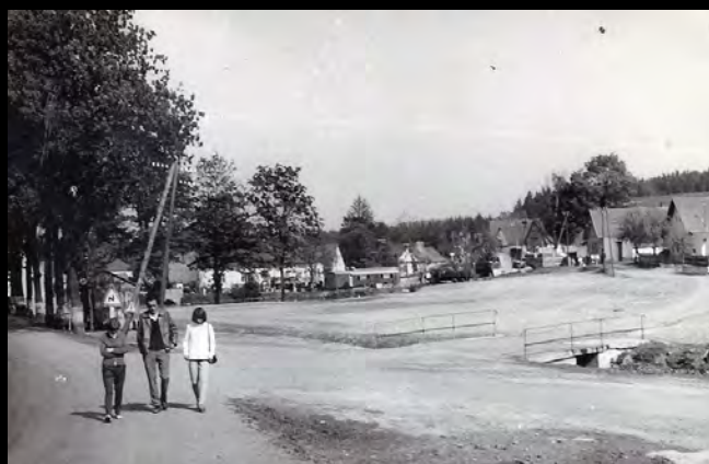
Návěs před dokončením, 70. léta