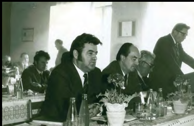
Výroční schůze JZD Jetřichovec, 80. léta