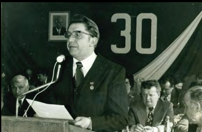
Stranicko-ekonomická konference okresu Pelhřimov, 1978