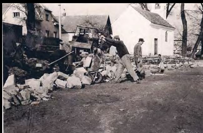
Úpravy návsi, 70. léta