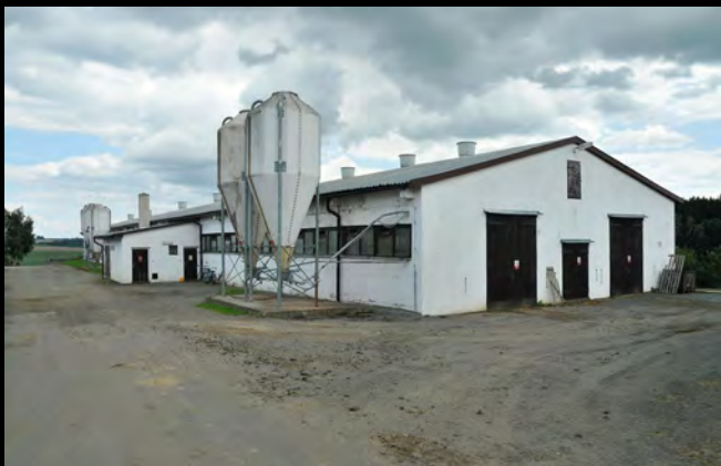
VOD Jetřichovec – odchovna prasnic