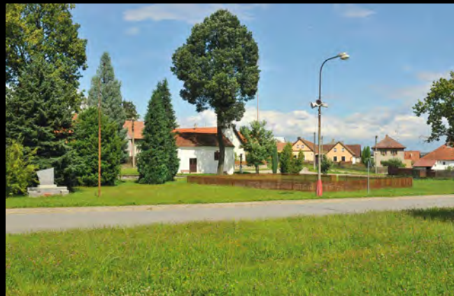
Náves s kapličkou, pomníkem a vodní nádrží